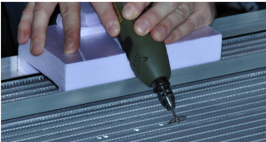
Úpravy voštinového systému

Funkční vzorek výměníku voda-vzduch má upravený voštinový systém. Tyto vývojové úpravy mají za cíl snížit odpor chladícího vzduchu, proudícího skrz výměník, při zachování výkonových parametrů z hlediska přestupu tepla. Výměník je určen pro měření vlivu úprav voštin na sledované parametry na aerodynamickém tunelu. Jeho cílem je podpořit výzkum v oblasti tepelných výměn ve výměnících. Fotografie ukazuje modifikaci voštinového systému na chladiči.